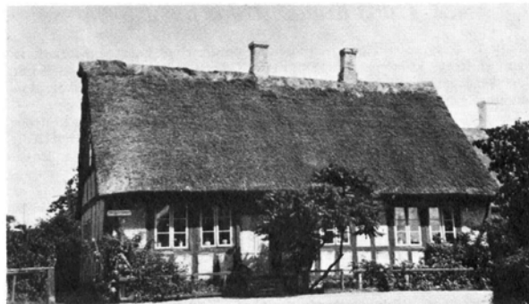
Den gamle skole i Skibhusene (H. P. Smith)

Indenrigsministeriet resolverede vel under 3. Februar 1871, at Slottet hørte til Landdistriktet, men Spørgsmaalet blev derefter bragt for Domstolene. Efter at Overretten havde givet Landdistriktet Medhold, vedblev dette med at opkræve Skat af Beboerne. Men da Højesteret kom til et modsat